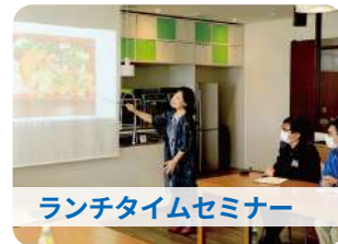
ランチタイムセミナー