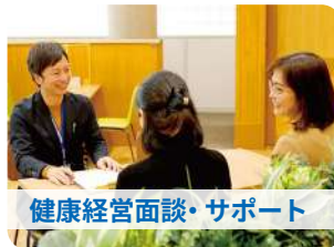
健康経営面談・サポート