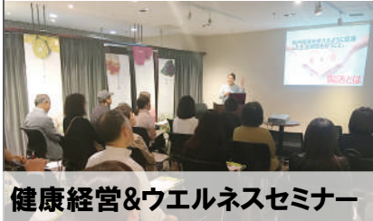
健康経営&ウェルネスセミナー