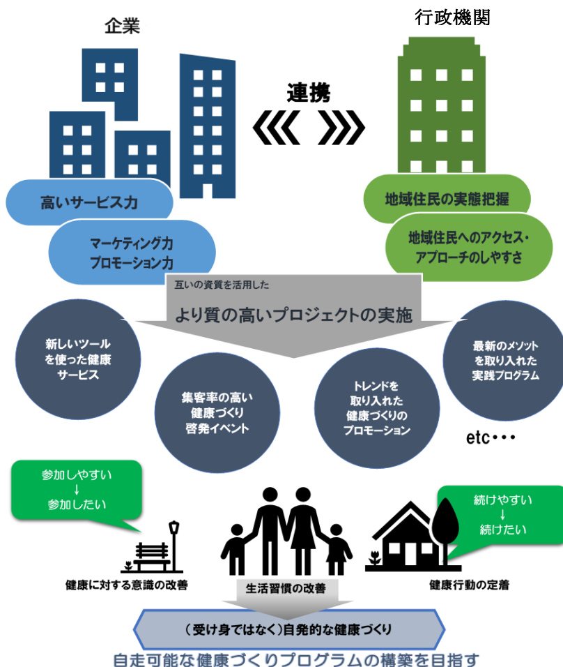
図1. 募集する事業の概要図